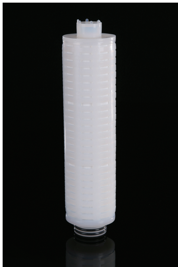
Примечание: TETPOR является зарегистрированной торговой маркой Parker domnick hunter